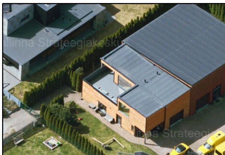
Joonis 2. Väljavõte Maa- ja Ruumiameti kaldaerofotost